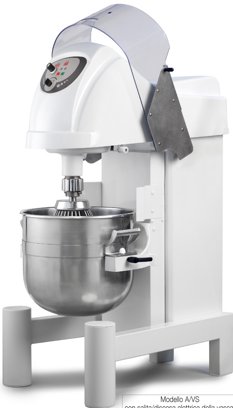
Modello A/VS con salita/discesa elettrica della vasca.