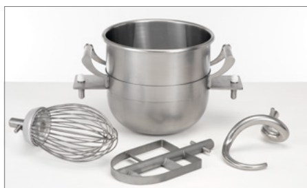
Kit di riduzione