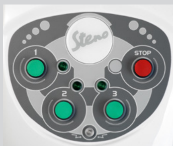
Modello 3VS a 3 velocità preimpostate