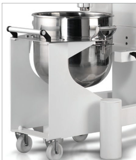
Carrello per estrazione vasca