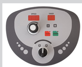
Modello A/VS a velocità variabile