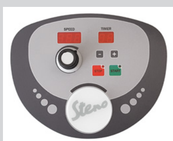
Modello VS a velocità variabile