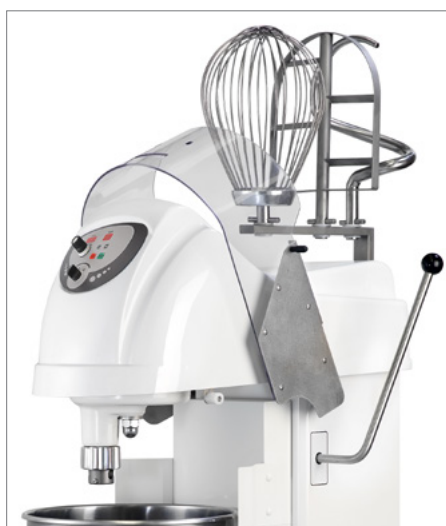
Supporto porta utensili